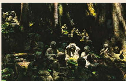
「個性あふれる羅漢様」 野中章雄(栃木市)