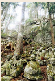
「並んだ羅漢様」 西山栄(いわき市)