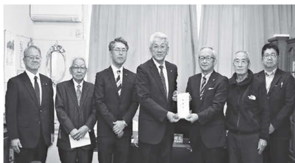
小野ロータリークラブ様から寄付贈呈