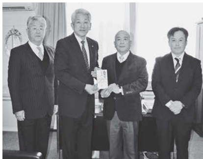
大東しゃくなげ会様から寄付贈呈