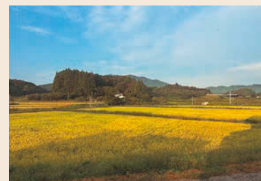
「おはようの景色」 石井文智(小野町)